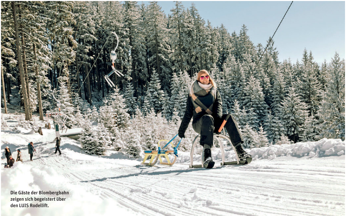
Die Gäste der Blombergbahn zeigen sich begeistert über den LUIS Rodellift.