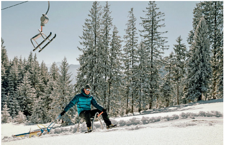
Der LUIS Lift wurde mit Rodeln als Sitzgelegenheit ausgestattet, eine Rodel bietet Platz für einen Erwachsenen und ein Kind.

Ab Herbst steht bei enrope außerdem die erfolgreiche und vielfach bewährte Tellerlift-Einziehvorrichtung „Typ 200 GL“ wieder zur Verfügung. Aus der Spezialwerkstatt, in der man für den professionellen Reparatordienst bestens gerüstet ist, gibt es aus der eigenen Produktion außerdem Ersatzteile wie Rollengummi, Gummizapfen, Bügelanschlussstücke, Bruchstäbe, Schleppseile usw. Für alle, die für Ihren Lift Ersatzteile suchen, die am Markt nicht mehr oder nur mehr schwer zu bekommen sind, empfiehlt sich auf alle Fälle eine Kontaktaufnahme mit enrope. lw